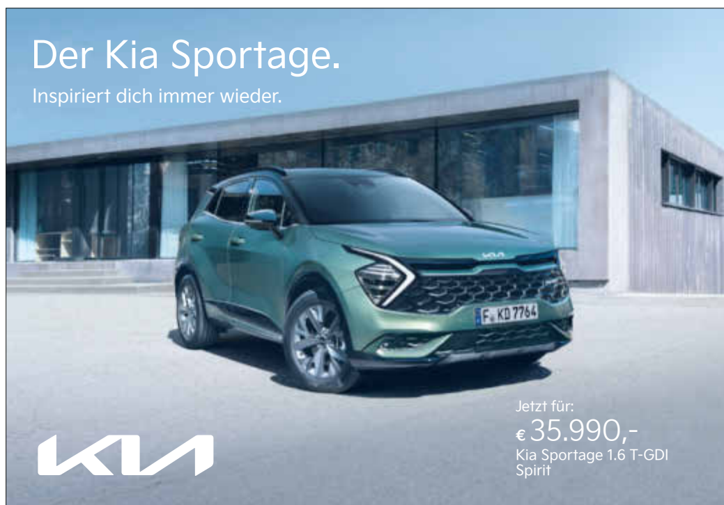
Abbildung zeigt kostenpflichtige Sonderausstattung.

Das Faszinierende an modernen Technologien: Sie geben dir alle Möglichkeiten und eine ganz neue Freiheit. Ob du im Kia Sportage mit effizientem Verbrennungsmotor oder alternativem Antrieb unterwegs sein willst - du hast die Wahl. Folge einfach deinen Zielen, immer mit dem guten Gefühl, dass intelligente Assistenzsysteme dich auf jeder Fahrt begleiten. Erlebe den Kia Sportage jetzt bei einer Probefahrt.